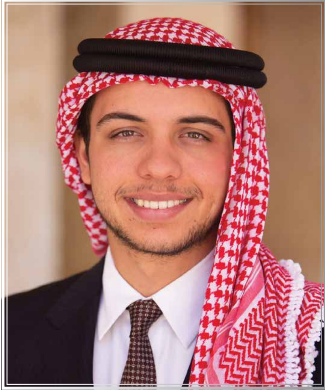
حضرة صاحب السمو الملكي الحسين ابن عبدالله الثاني ولي العهد