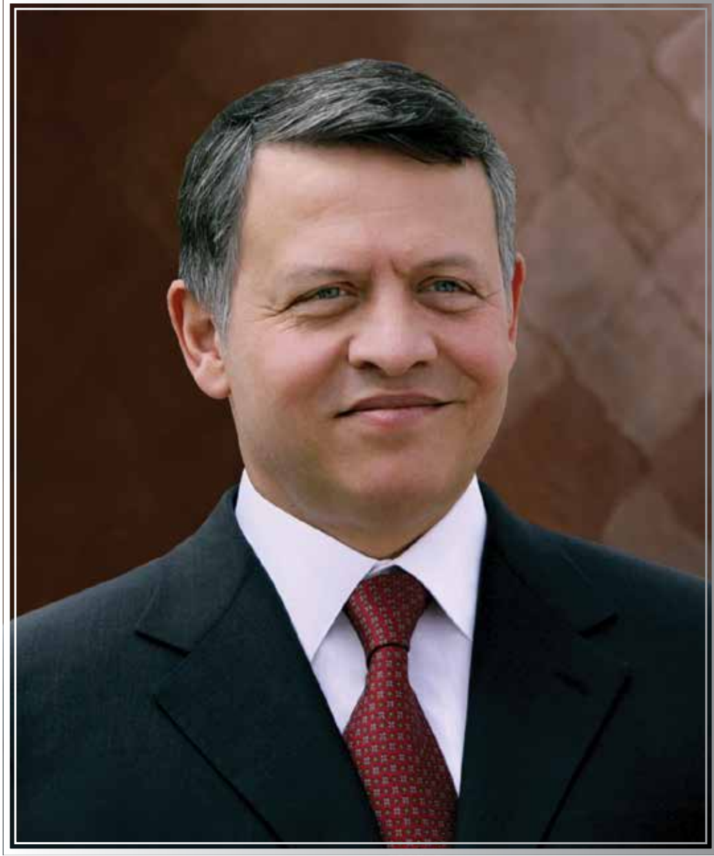
حضرة صاحب الجلالة الملك عبدالله الثاني ابن الحسين المعظم