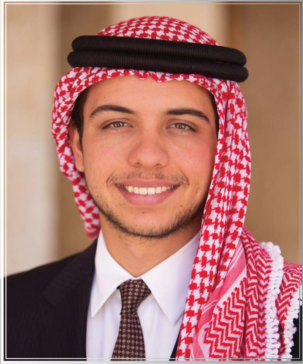
حضرة صاحب السمو الملكي الحسين ابن عبدالله الثاني ولي العهد