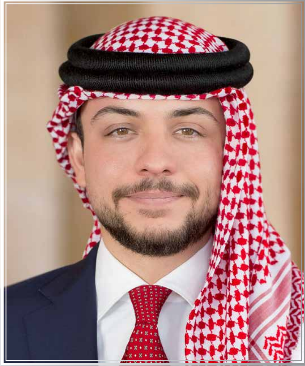
حضرة صاحب السمو الملكي الحسين ابن عبدالله الثاني ولي العهد